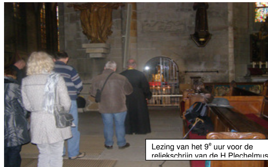
Lezing van het 9 e uur voor de relikvieschriin van de H Plechelmus

Vervolgens hebben we er onze meegebrachte lunch genuttigd. Daarna gingen we Oldenzaal weer in, waar we in een café koffie of chocolademelk gedronken hebben om onze verkleumde ledematen weer wat op te warmen. We hadden immers een tijd stilgestaan bij de kapel. Daarna zijn we naar de Plechelmusbasiliek gegaan, waar we een uitvoerige rondleiding kregen. Deze kerk bleek veel indrukwekkender te zijn dan we hadden verwacht. Ook haar rijke historie kwam tijdens de rondleiding duidelijk aan bod. Tenslotte werd bij de relikven van de H. Plechelmus gezamenlijk het 9e Uur gebeden. Tijdens het