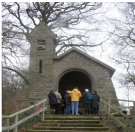
Mariakapel op de Tankenberg met op de onderstaande foto het interieur

de Tankenberg over, naar de daar gelegen Mariakapel. Daar hebben we het 6e Uur gebeden. Vrijwel iedereen heeft een deel van dit Uur voor zijn of haar rekening genomen.