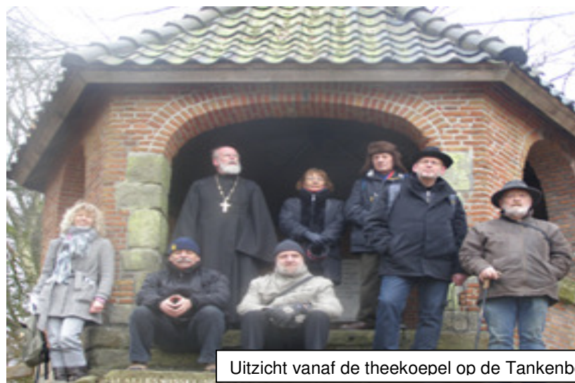
Uitzicht vanaf de theekeupel op de Tankenberg