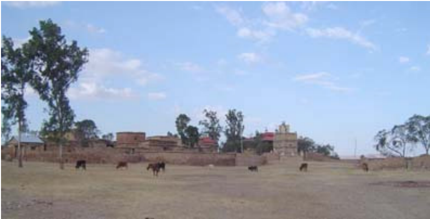
Klooster bovenop de Amba