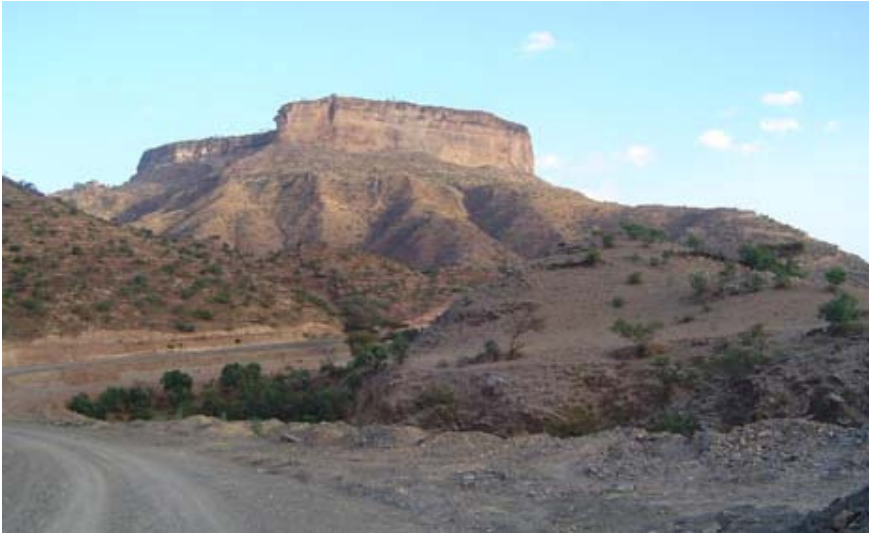
Amba (een soort tafelberg met een platte top)