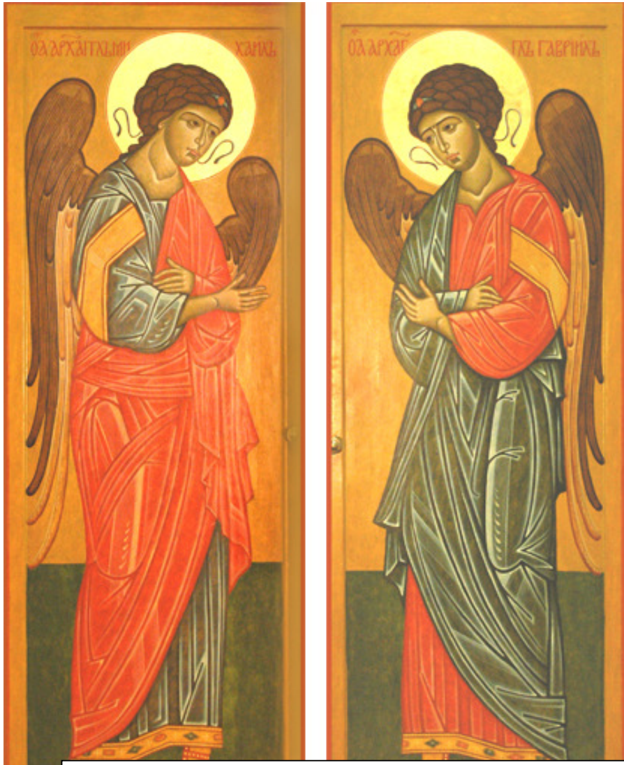
Aardengelen op de altaardeuren v/d Russisch-Orthodoxe Parochie, Deventer.